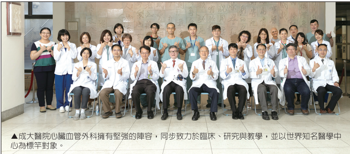
▲成大醫院心臟血管外科擁有堅強的陣容，同步致力於臨床、研究與教學，並以世界知名醫學中心為標竿對象。